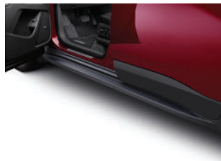
사이드 스텝 : 820,000