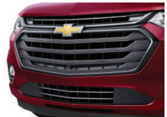
쉐보레 블랙 그릴 : 450,000