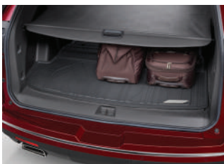
러기지 쉐이드 : 170,000