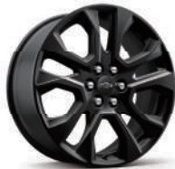
20인치 다크 안드로이드 페인티드 알로이 휠 (RS 적용)