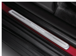
LED 도어 실 플레이트 : 320,000