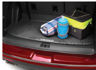
프리미엄 러기지 매트 : 90,000