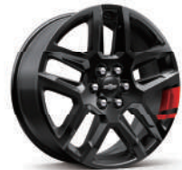
20인치 레드라인 시그니처 블랙 알로이 휠 (레드라인 전용)