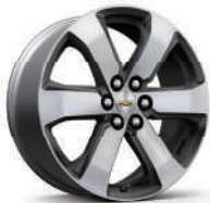
20인치 테크니컬 그레이 포켓 머신드 알로이 휠 (LT Leather & LT Leather Premium 적용)