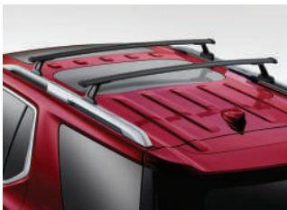
루프 크로스 바 : 340,000