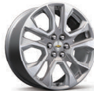
20인치 아전트 메탈릭 머신드 알로이 휠 (Premier 적용)