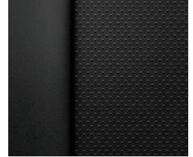
젯 블랙 천공 천연가죽 시트