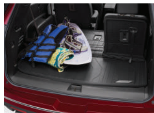
프리미엄 러기지 라이너 : 160,000