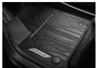
프리미엄 플로어 라이너(1열) : 130,000