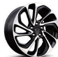
17 인치 머신드 블랙 투톤 알로이 휠